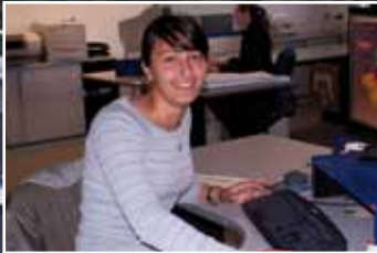
Technische Zeichnerin (m/w)